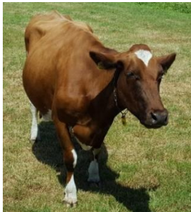
Die Kuh frisst nicht.

Richtiges Bild aufgrund folgender Aussagen auswählen: